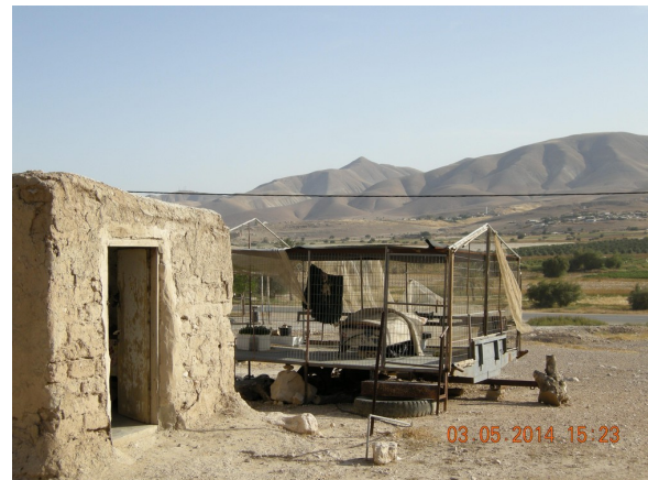
La maison actuelle de Hamda

Quelques mètres plus haut, Hamda possède une seconde maison, très ancienne (les écritures sur la porte prouvent qu'elle remonte à l'époque de l'occupation jordanienne), et dans des matériaux naturels, mais dans un trop mauvais état pour y vivre.