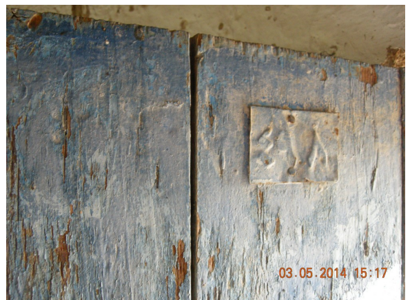
Les écritures datant de l'époque jordanienne

Quelques mètres plus haut, Hamda possède une seconde maison, très ancienne (les écritures sur la porte prouvent qu'elle remonte à l'époque de l'occupation jordanienne), et dans des matériaux naturels, mais dans un trop mauvais état pour y vivre.